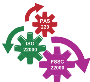
Схема сертификации FSSC 22000 является результатом дополнения требований стандарта ISO 22000:2005 требованиями спецификации ISO/TS 22002-1 (PAS 220), PAS 223 (Упаковка), PAS 222 (Корма для животных) дополнительными требованиями FSSC 22000.

На протяжении многих лет был введен ряд международных стандартов, дающих возможность предприятиям – производителям пищевых продуктов обеспечивать потребителей качественными и безопасными пищевыми продуктами. В 2000 году была создана Глобальная инициатива по обеспечению безопасности пищевых продуктов – GFSI, главной целью создания которой являлось обеспечение выпуска безопасных пищевых продуктов во всем мире путем внедрения и сертификации систем менеджмента предприятий пищевой промышленности в соответствии с признаваемыми схемами сертификации, в числе которых FSSC 22000.